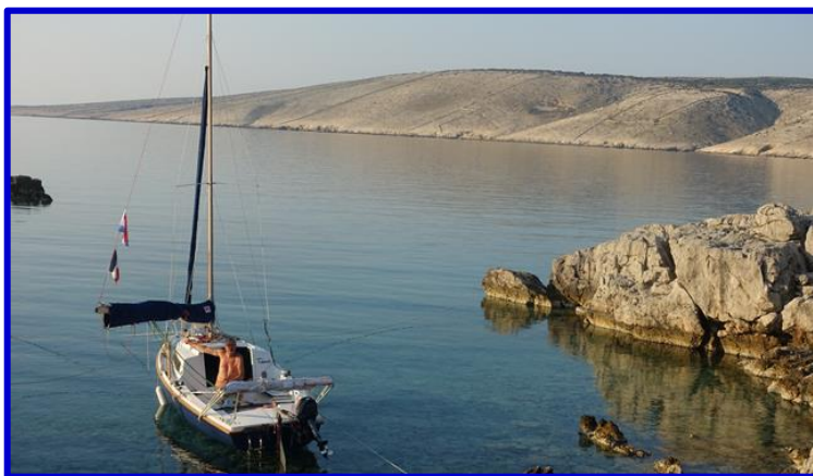
Tahuret – Croatie 2020