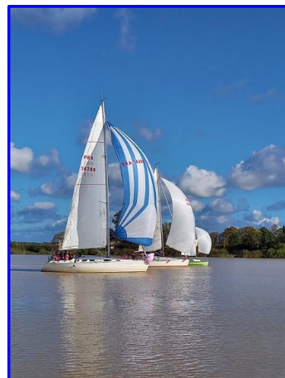
Le Courlis – TER 2020